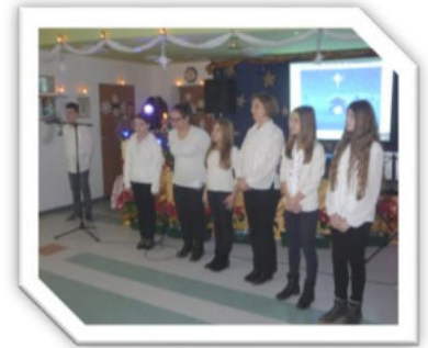
Tanulóink kiváló felkészültséggel tesznek eleget városi-, járási-, intézményi rendezvényekre történő meghívásoknak.