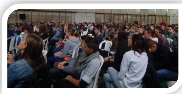
A Nyírségi Református Egyházmegye minden évben iskolánkban rendezi meg Konfirmandus találkozóját többszáz résztvevővel.