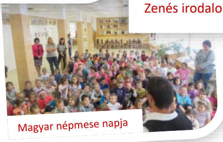
Magyar népmese napja