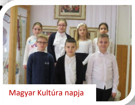
Magyar Kultúra napja