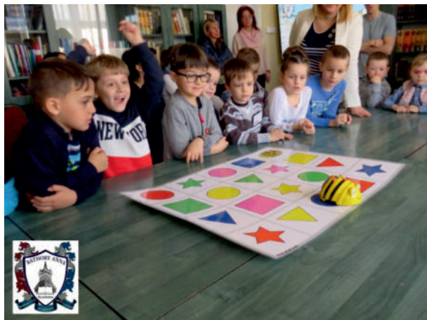
LEGO matek - Robotika Informatika