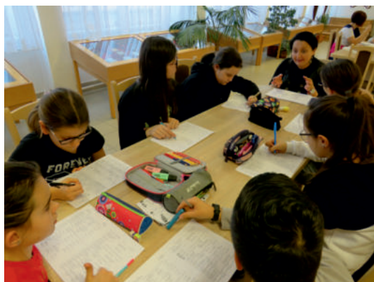
Angol - Német